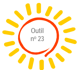
Tableau SVA concernant ma nouvelle école